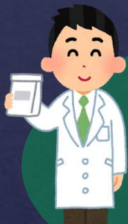
医療型障害児入所施設 (薬剤師)