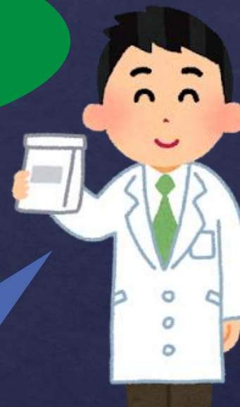
医療型障害児入所施設 (薬剤師)

概ね手帳に記載した調剤方法行えば 本人で薬の管理出来ます。 エルカルチンF F内用液は自分で 正確に量り取れます。 メスチノン錠は品薄なので手配早め をお願いします。